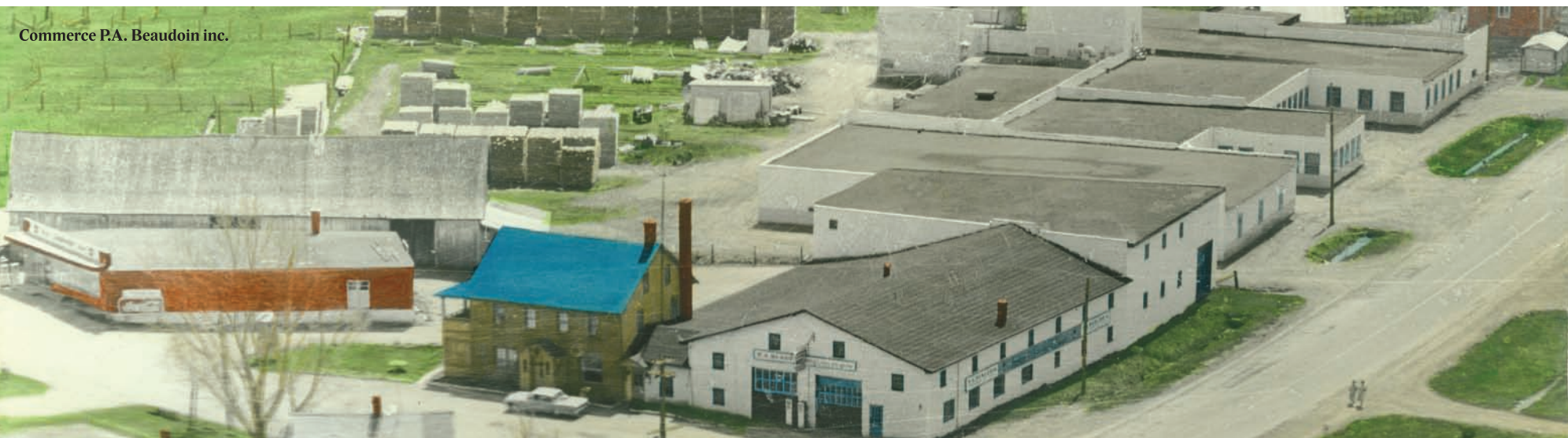
Commerce P.A. Beaudoin inc.